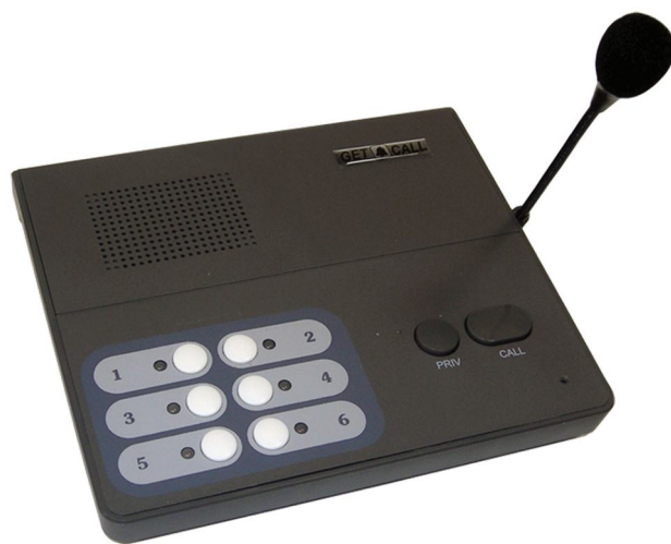
Рисунок 1. Внешний вид пульта GC-1006DG

Пульт GC-1006DG (рис.1) имеет пластмассовый корпус темно-серого цвета. На верхней поверхности пульта находятся кнопки выбора абонента, кнопка режима работы «PRIV», кнопка подачи общего вызова/сброса «CALL», решетка громкоговорителя, отверстие микрофона, светодиодные индикаторы абонентов. На задней боковой панели пульта имеется круглый разъем для подключения питания. На правой боковой стороне пульта расположены регуляторы громкости вызова и громкости динамика и разъем для подключения внешнего микрофона. В данный разъем устанавливается микрофон на гибкой стойке длиной 17 см.